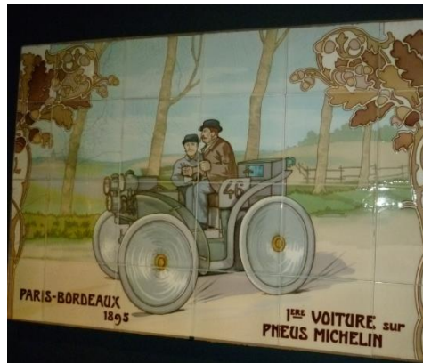
Affiche de la course automobile Paris-Bordeaux 1895

L'Aventure Michelin marque l'ouverture directe aux attentes de la société. Le succès des visites montre que ce signal est bien compris. À n'en pas douter, forte de ses valeurs et de son patrimoine, l'entreprise marque la volonté de faire face aux grands défis de la mobilité de demain. Nous sommes tous enclins à la suivre avec confiance.