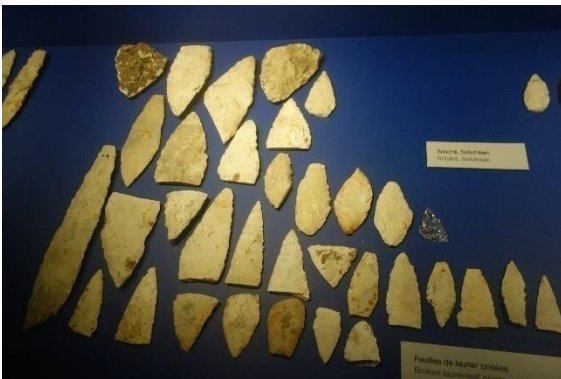
Feuilles de laurier

Tout au long de ces périodes il va améliorer ses techniques de chasse par la confection d'outils plus efficaces : utilisation des bois de cervidés, des os de Mammouth, taille de la pierre de plus en plus sophistiquée avec la confection de gravelles et de feuilles de laurier et plus tard de sagaies et de harpons.