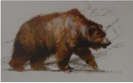
L'ours des cavernes