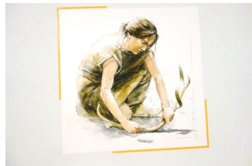
Travail du bois de renne

C'est alors la fin de la période glaciaire, le climat enfin tempéré, va favoriser les forêts et les prairies et homo sapiens deviendra agriculteur sédentaire.