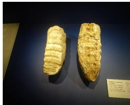
et ses dents

On peut citer aussi l'ours des cavernes, le cerf élaphe et bien entendu le cheval de Mosbach qui fera la célébrité du site en raison des nombreuses légendes propagées sur sa chasse qui sont en réalité des récits romanesques.