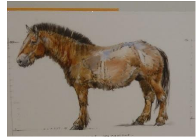
Le cheval de Mosbach

Les hommes de Neandertal furent les premiers à fréquenter le site 50 000 ans avant JC . Chasseurs exceptionnels, Ils utilisaient des outils en pierre pour désarticuler le gibier et traiter les peaux. Très consommateurs de viande ils chassaient les herbivores de grande taille comme les rennes et les bisons. On a retrouvé leurs ossements à Vergisson près de Solutré.